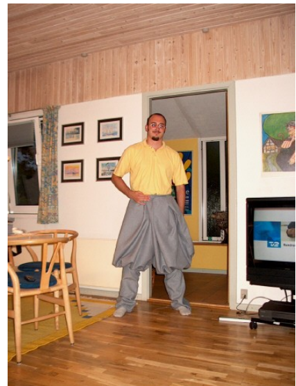
Begge ben er rimpet og syet sammen med (b) stykkerne, Ben stykkerne er så syet sammen til et sæt komplette bukser, kun (C) stykket mangler at blive syet på

Husk at hvis det går helt galt for dig, kan du også købe dine posebukser af en af Gnomerne her i værkstedet