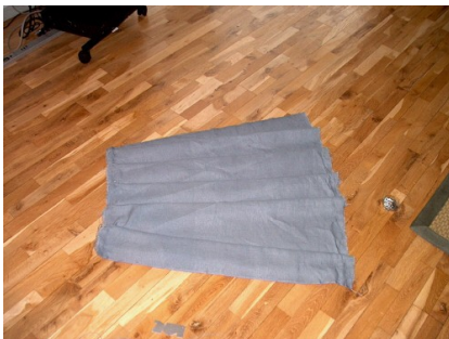
Et stykke (a) rimpet sammen i toppen, her er brugt fem brede rimpninger

Du kan også lukke bukserne med en løbegang i toppen i stedet for at bruge knapper. Men husk at lave et hul ved skridtet til tisseture, og til at gemme ting i bukserne, når du strammer benene med snørre kan selve posen ved lårene bruges som gigantiske lommer