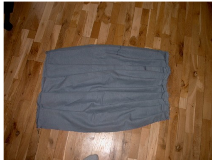
Samme stykke stof nu også rimpet sammen med 10 mindre rimpninger